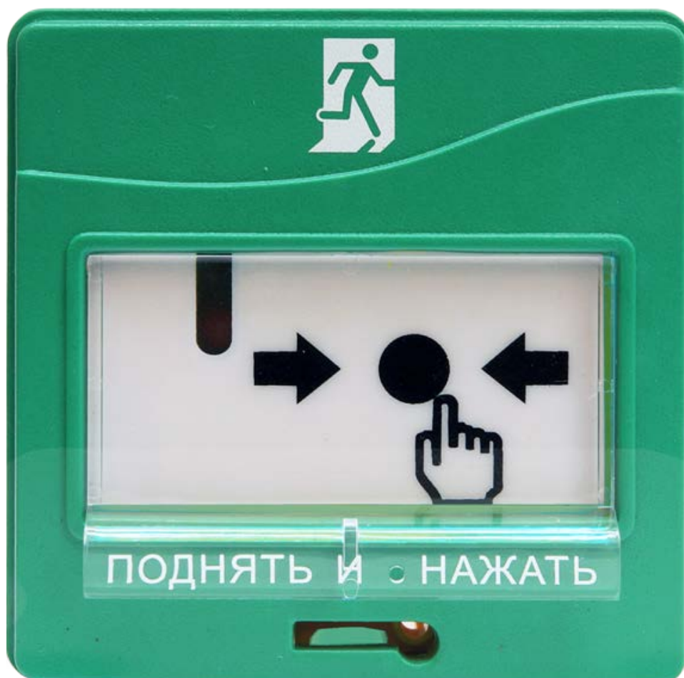
Рисунок 2.2.2.1 Внешний вид УДП